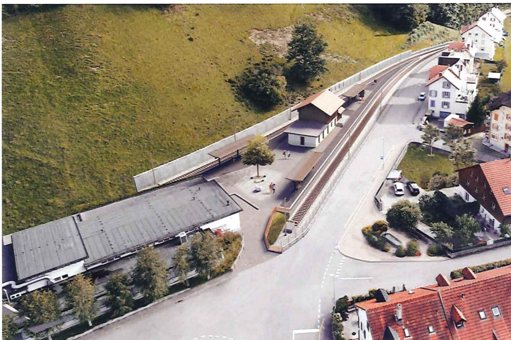
Photo montage des futurs aménagements de la gare de Broc-Fabrique © FADA ARCHITECTURE SARL

De nouveaux ouvrages de génie civil sont nécessaires pour accueillir la nouvelle infrastructure ferroviaire. Ces travaux importants se dérouleront durant 14 mois environ pour une mise en service de la ligne durant le 2 e semestre 2023. Ils débuteront dès la mi-mai 2022.